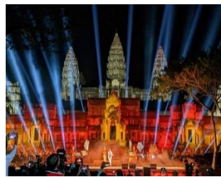
เสียมเรียบ