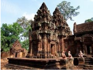
บันทายศรี กัมพูชา

ถึงเมืองเสียมเรียบ เช็คอิน ANGKOR HOLIDAY HOTEL