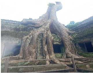
กัมพูชา ตาพรหม