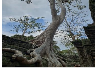
ปราสาทบายน กัมพูชา