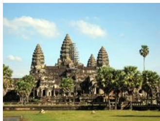
กัมพูชา นครวัด