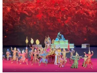
การแสดง ร้านอาหาร